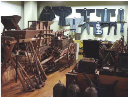
馬瀬歴史民俗資料館