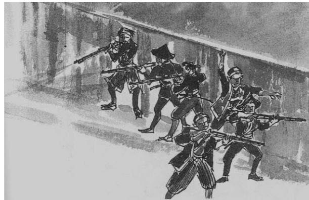
市街戦おこる