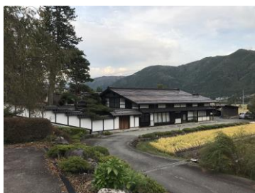
都筑家 (国指定有形文化財)