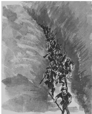
徒党、萩原の市街へ(はぎわら文庫より)